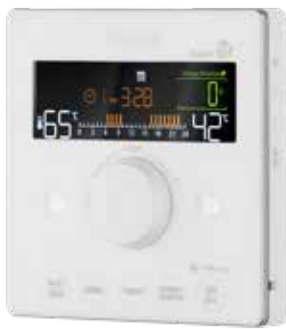
Περιλαμβάνεται έγχρωμο τηλεχειριστήριο με τεχνολογία Wi-Fi